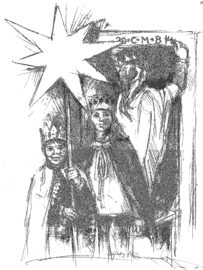
Die Sternsinger heben einen wahrhaft königlichen Ausruf: Sie sind Botschafter der Liebe.

Wir beten für die Freude in der Nachfolge Christi und im Dienst an den Armen für alle zum Ordensleben Berufenen.